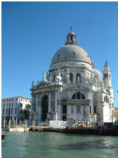
Basilica di Santa Maria della Salute

La Festa della Madonna della Salute, celebrata a Venezia il 21 Novembre, è una straordinaria e singolare fusione armonica di sacro e di profano, di fede religiosa e di tradizione civica, di tradizione popolare e momento istituzionale, di liturgia e di sagra. La Festa istituita dal Senato della Serenissima nel 1630 per celebrare la protezione che la Vergine stese sulla città in occasione di una feroce pestilenza, conduce ancora oggi migliaia di cittadini alla Basilica, il cui splendore barocco si deve all' arte dell' architetto Baldassarre Longhena.