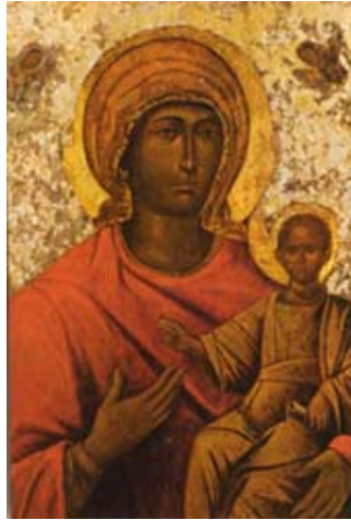
Santa Maria della Salute

È una tradizione ancora vitale e diffusa che, con una bella definizione, 'si radica nel futuro', cioè passa attraverso le generazioni. L'antica icona di Santa Maria della Salute, la Madonna nera, richiama le folle al grande tempio dove si esprimono le due anime della festa: all'interno, sotto la cupola del Longhena, si celebrano liturgie sacre e si elevano preghiere e suppliche, mentre fuori le bancarelle attraggono bambini e adulti in un'atmosfera da sagra di sestiere.